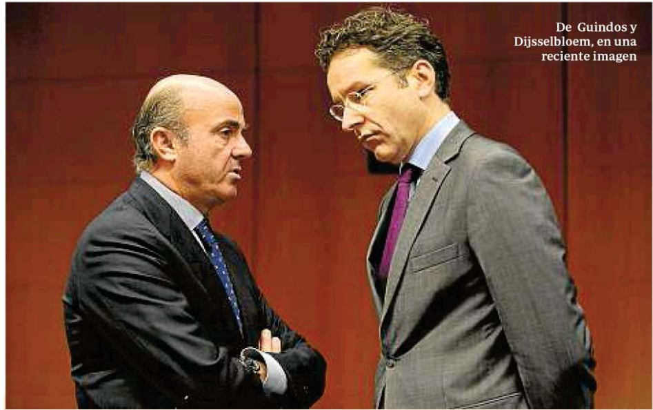
De Guindos y Dijsselbloem, en una reciente imagen

Los expertos consultados recomiendan que, en primer lugar, pidan la revisión catastral. En caso de desidia por parte de la Administración, pueden tratar de impugnar el próximo recibo del IBI basándose en la sentencia del Tribunal Supremo y en esta ley.