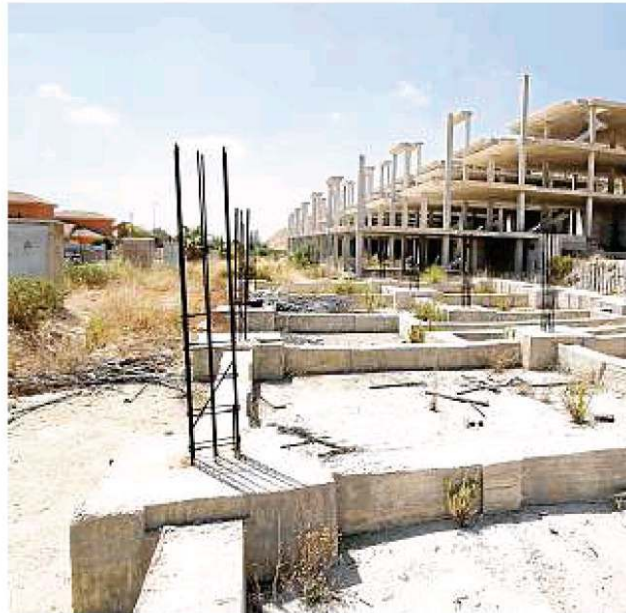
Las obras de una urbanización en Alicante, paralizadas por la crisis económica

Esta merma de ingresos representa una tercera parte de lo que recaudó el IBI en 2014, unos 12.032 millones. Hasta 900.000 fincas podrían reducir su tributación. El IBI ha sido los últimos años el salvavidas fiscal de los ayuntamientos. Es su principal fuente de ingresos