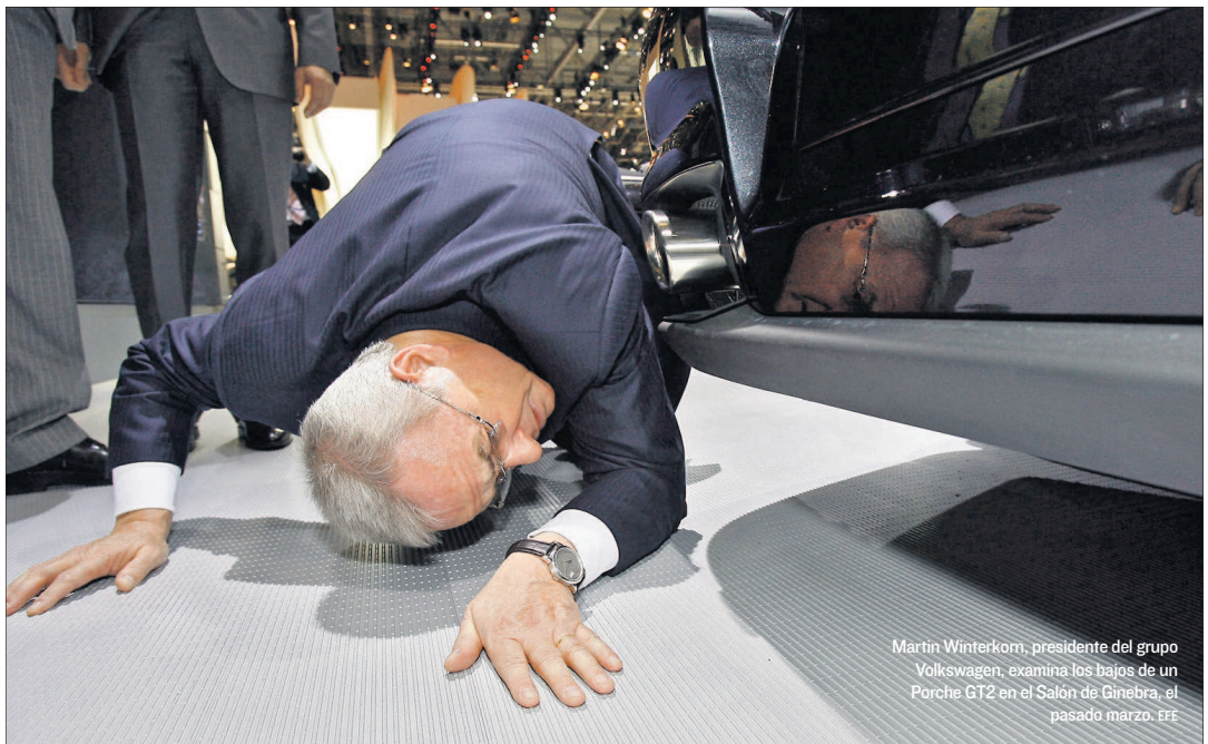
Martin Winterkorn, presidente del grupo Volkswagen, examina los bajos de un Porsche GT2 en el Salón de Ginebra, el pasado marzo.

■ La crisis impacta en numerosos suministradores de la multinacional